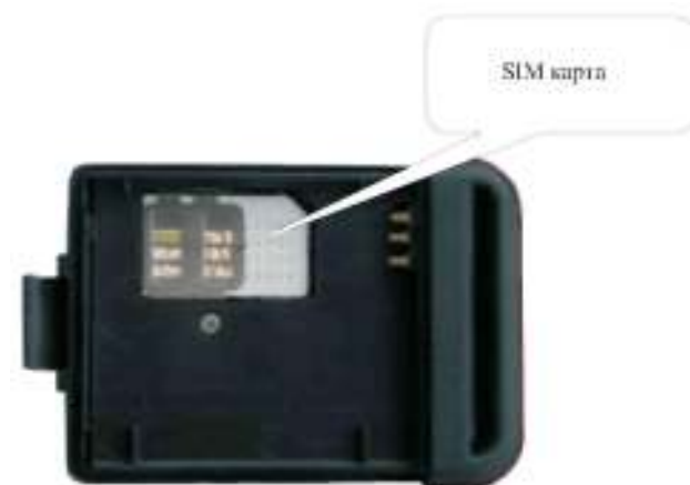
Установка SIM карты